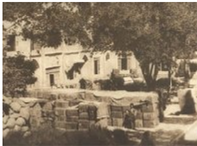
(مرکز انحصار توتون و تنباکوی ایران در تهران)

در نیمه دوم قرن نوزدهم حوادث و اتفاقاتی در ایران رخ داد که چهره ی آینده ی کشور اسلامی را تا مدودی متمول و دگرگون کرد.